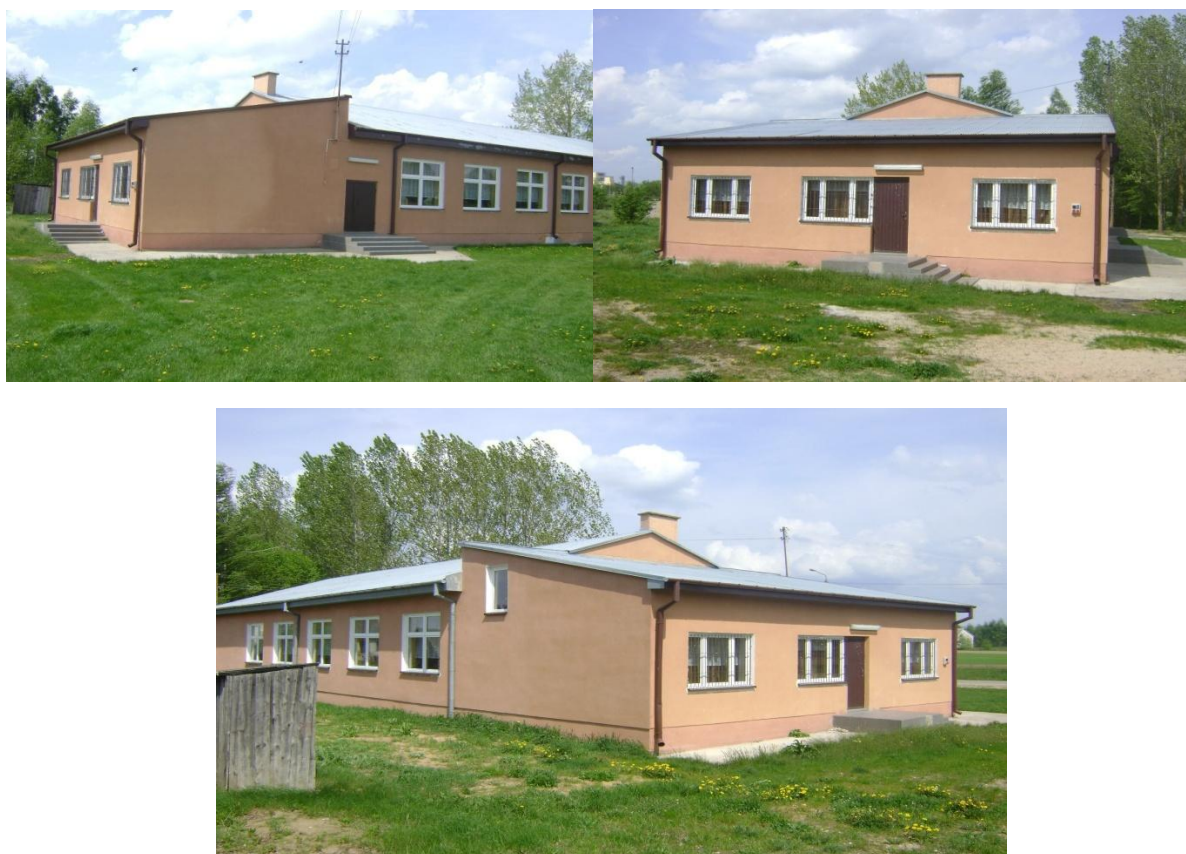
Rys.3 Świetlica wiejska w Starym Ratowie

wyposażonej świetlicy wiejskiej, ponieważ obecna mimo wysiłku mieszkańców potrzebuje jeszcze min. zakupu gier dla dzieci i młodzieży, zagospodarowania terenu wokół tj. wyrównanie terenu i ułożenie na nim kostki brukowej (parking), te miejsca służyły by mieszkańcom do spędzania wolnego czasu.