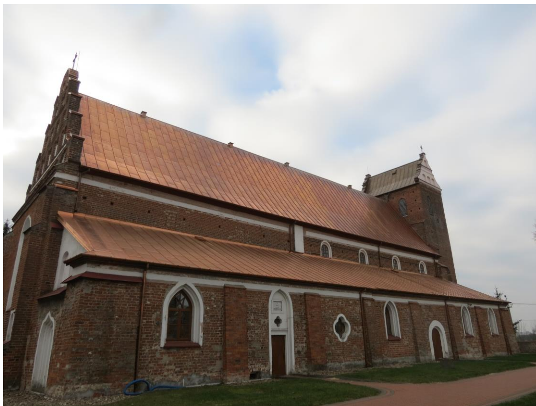
Kościół parafialny w Szczepankowie, fot. M. Karczewska.

Kościół Benedyktynów, ob. parafialny p.w. św. Wojciecha w Szczepankowie został wzniesiony w stylu gotyku mazowieckiego w latach 1537-1547 przez opatów plockich - Łukasza i Jana Dziedzickich. Konsekrowany w 1547 r. przez biskupa plockiego. Szczyty wieży przekształcono około 1618 roku. Kościół był kilkakrotnie remontowany w XIX i XX w. Do 1822 r. opiekę duszpasterską nad parafią sprawowali Benedyktyni z klasztoru w Pułtusk. Obok kościoła stoi murowana kaplica grobowa, zbudowana dla Franciszki ze Skarżyńskich Grabowskiej (zm. 1856).